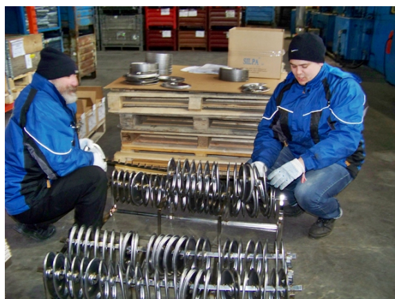
В контрола се включи и инженерния състав