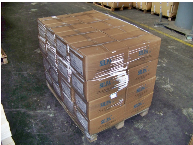
Опаковани детайли за Толиати, Русия - за новата Лада Приора.

Опаковките на Форесия - готови за експедиция. За да не се нарушава логистиката на клиента обратните сини кутии и пластмасови палета са абсолютно забранени за друга употреба освен за детайли на Форесия, Крайова.