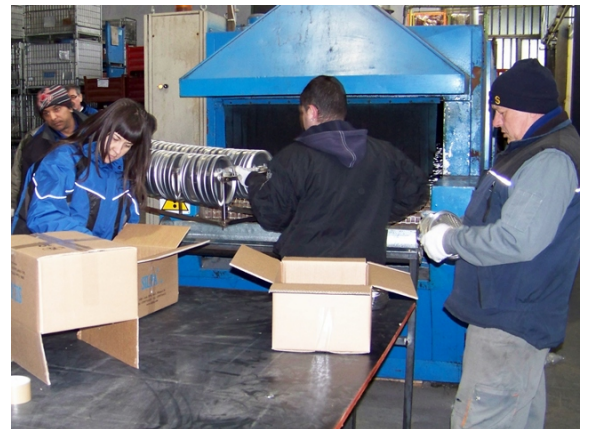
Преглед и опаковане на новото производство

линия, отдела по качеството и не на последно място - администрацията. На 18 април представители на фирмата участваха в "Деня на доставчика" на Форесия в Крайова, където бяха уточнени изискванията на клиента по някои въпроси, касаещи качеството, опаковането и доставките на детайлите за Форд. Изискванията бяха включени незабавно в обучението на отговорниците по качеството и отговорниците за контрола и опаковането на детайлите.